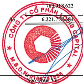
Tổng Giám đốc Hà Nội, ngày 19 tháng 10 năm 2021